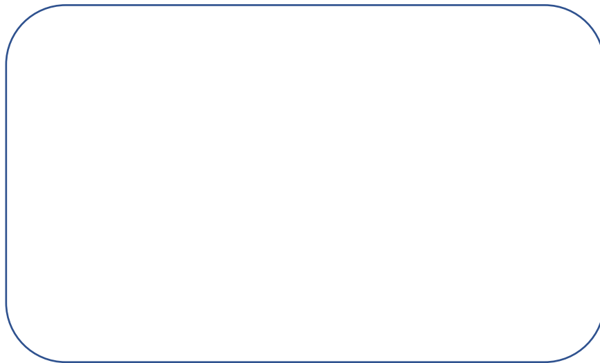
圖二：高二大隊接力比賽第二名獎狀