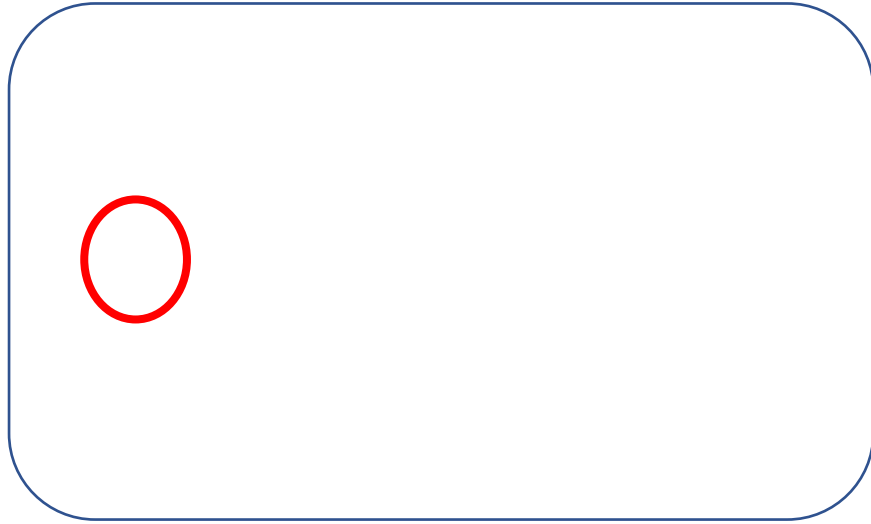
圖三：龍舟賽賽後全隊合影（紅圈人像是我）