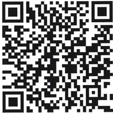
比賽報名專址 QR Code